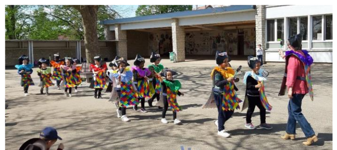
École Champs d'Aloup