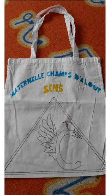
École Champs d'Aloup