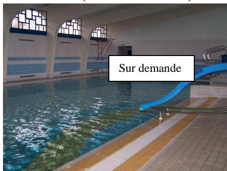
Petit bain (de 0.60 à 1.20m)