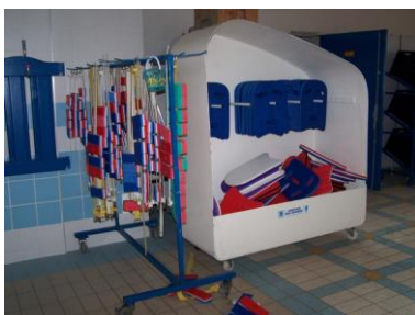
ceintures et planches