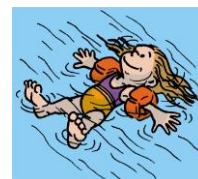
FLOTTER flotter flotter