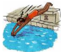
PLONGER plonger plonger