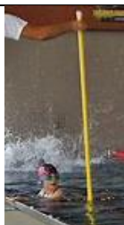
LA PERCHE la perche la perche