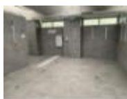
LES DOUCHES les douches les douches