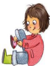
SE RHABILLER se rhabiller se rhabiller