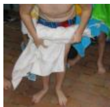
SE SECHER / S'ESSUYER se sécher / s'essuyer se sécher / s'essuyer