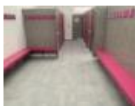
UN VESTIAIRE un vestiaire un vestiaire