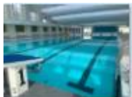
LE BASSIN le bassin le bassin