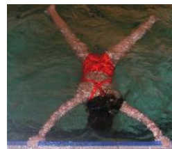
S'ALLONGER SUR LE VENTRE s'allonger sur le ventre s'allonger sur le ventre