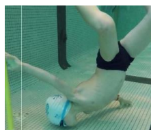
TOUCHER LE FOND toucher le fond toucher le fond