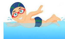
SE DEPLACER se déplacer se déplacer