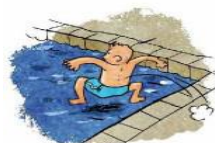
SAUTER sauter sauter