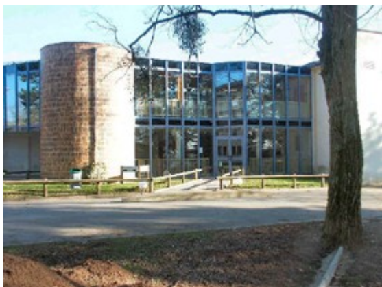
Lycée des Chaumes

Votre classe sera hébergée dans l'internat du lycée des Chaumes à Avallon.