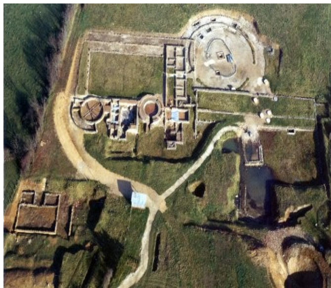
LES FONTAINES SALEES

Le patrimoine naturel avec notamment la Maison du parc régional du Morvan à Saint Brisson.